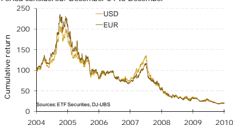
DJ-UBS F3 Natural Gas Total Return Historical Performance Period considered: December 04 to December