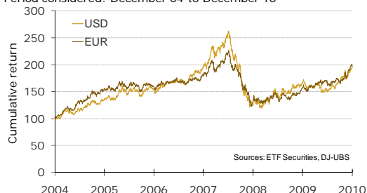
DJ-UBS F3 All Commodity Total Return Historical Performance Period considered: December 04 to December 10